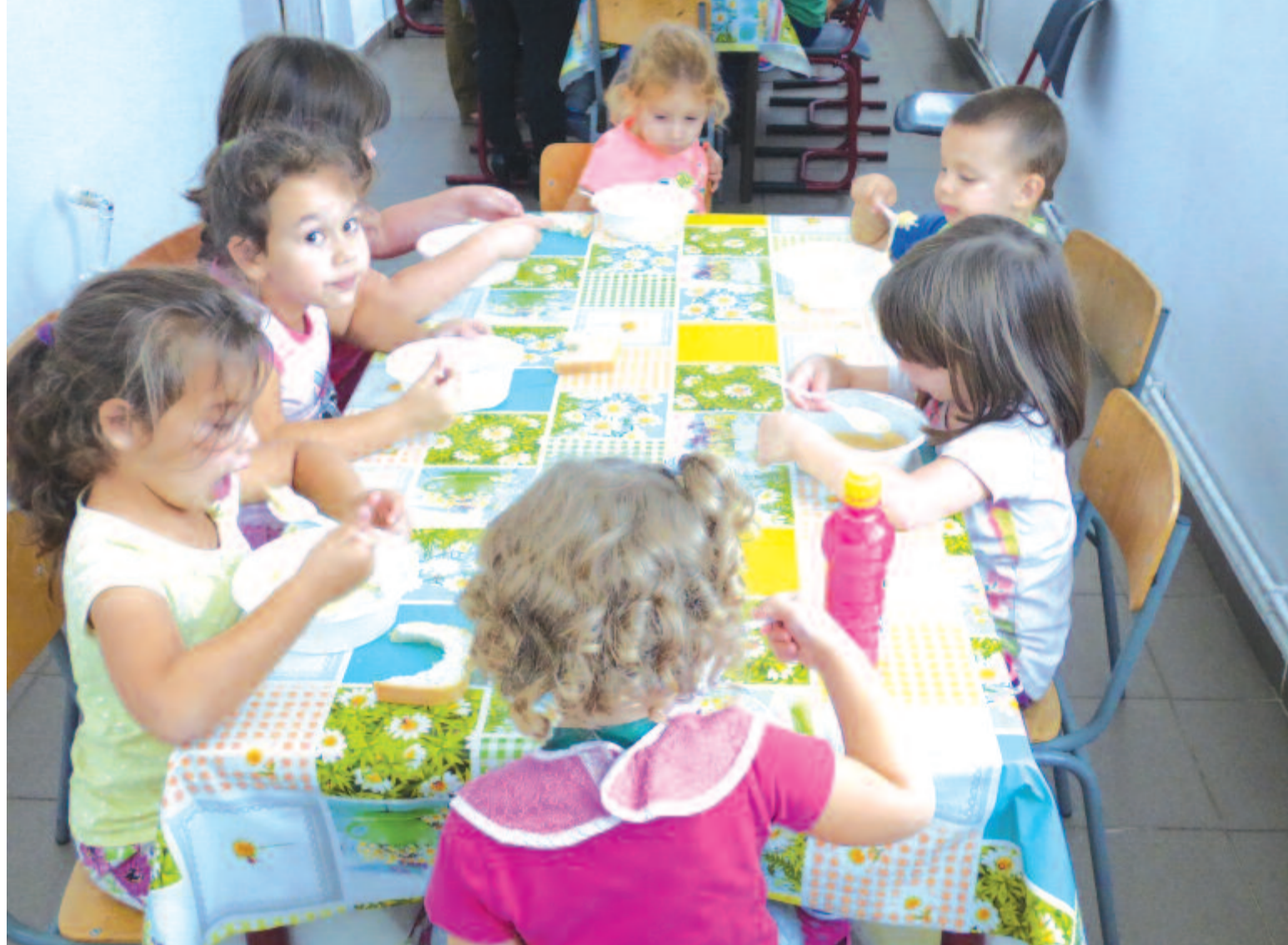
Sok óvodában van lehetőség a hosszabbított programra